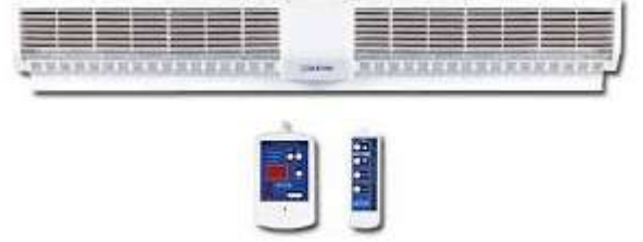
Kapı üzeri hava perdesi ( Opsiyon )