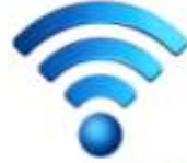
Telefonlarınıza Uyarı mesajı