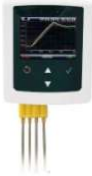
Oda sıcaklığını kontrol İçin ilave sensor