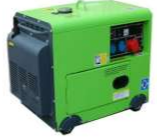
JENERATÖR ( Opsiyon )